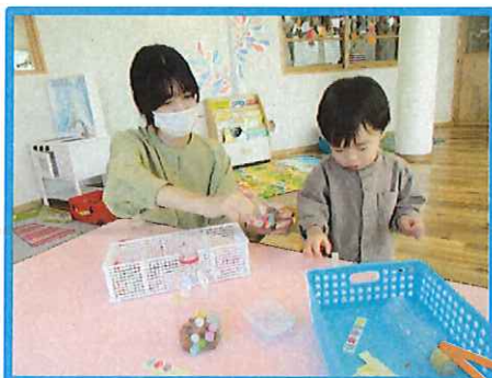
マラカス作りの様子♪