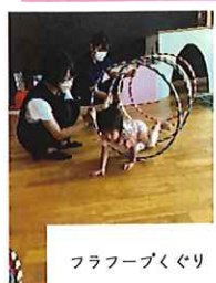
フラフープくぐり