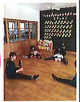
ベビーマッサージ